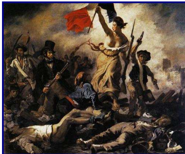
Liberté, égalité, fraternité?

prezzi (ancorché "santificata" dall'Authority per l'energia elettrica ed il gas); g) blocco settimanale - a monte ed a valle - dei prezzi.